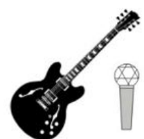
Gitarre Sergej 230V