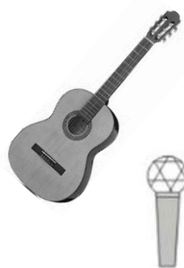
Gesang / Akustikg. Tobi 230V