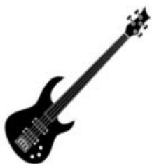
Bass Nico 230V